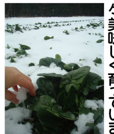
ほうれん草雪の中でも益々美味しく育っています