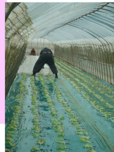
レタス寒さの中では二重に防寒してやるんだ