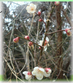
梅の花もほころび始め！