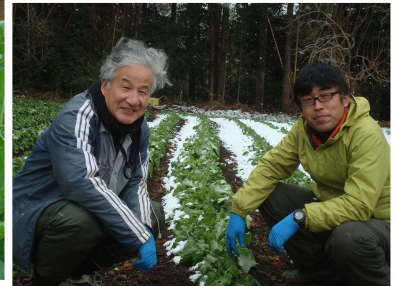
雪の中の収穫はちょっとつらいけど美味しいからし菜ですよ