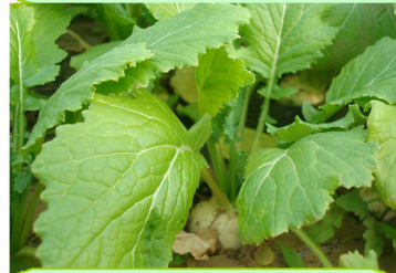
かぶもコロコロに成長して来ました