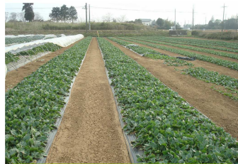
育ちの悪かったほうれん草が急に育ってしまっ