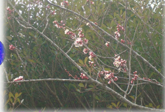
桃が咲き始めました