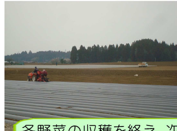
冬野菜の収穫を終え、次の作への準備に忙しい畑もあり、緑肥を育てて力を蓄える畑もあり..