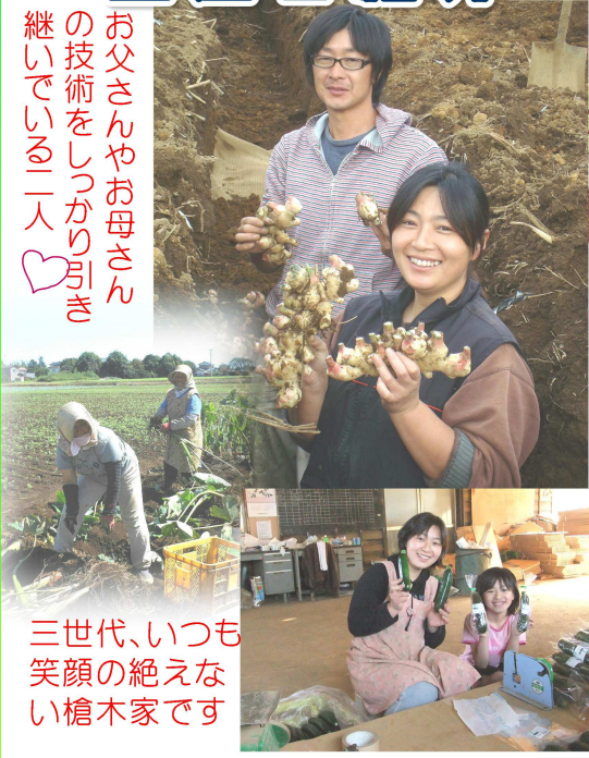
三世代、いつも笑顔の絶えない槍木家です