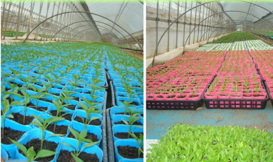
夏野菜の苗づくりも順調！ 混じらないように品種毎にポットの色を変えています