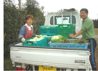
さんぶは今、レタスの最盛期。生食でも火を通してモシャキシャキの美味しいレタスだと自負しています