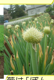
葱は「ぼんぼ」を出して次の世代にバトンタッチ