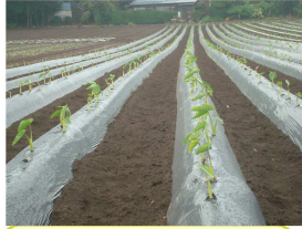
すくすく育っています。「里芋」