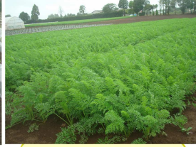
人参も勢いよく順調です